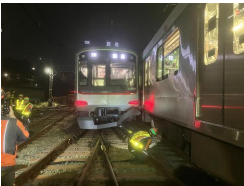
▲事故現場（渋谷方から撮影）