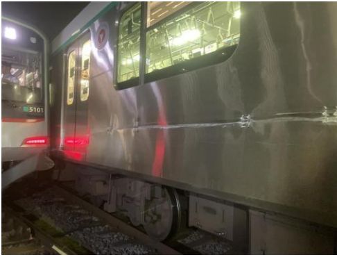
▲左：列車②（回送列車） 右：列車①（営業列車）