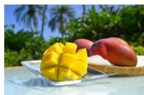
まいばり 宮古島熱帯果樹園 関連商品 (宮古島)