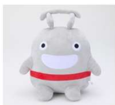
東急電鉄 東急線キャラクターのるるんグッズなど