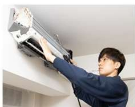
東急ベル ハウスクリーニングチケットなど