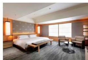
東急ホテルズ ギフトカード (ご宿泊やお食事にお使いいただけます)