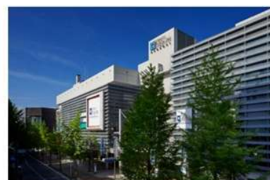
青葉台東急スクエア ほか 東急スクエア各店