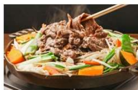
じょうてつ 関連商品 (北海道)