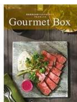
東急百貨店 選べるカタログギフトなど