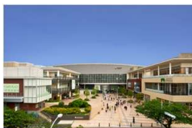
たまプラーザ テラス