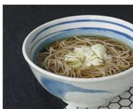
しぶそばご優待券