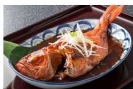
伊豆急ホールディングス関連商品 (伊豆エリア)