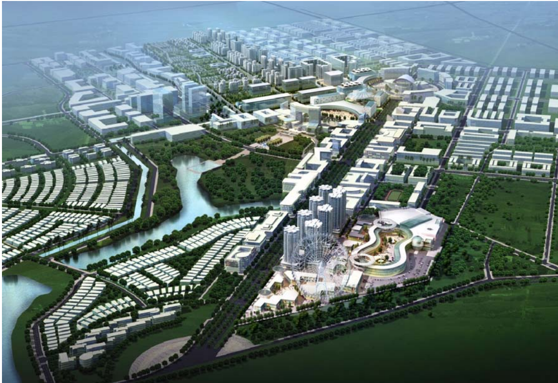
(ビンズン新都市全体像)