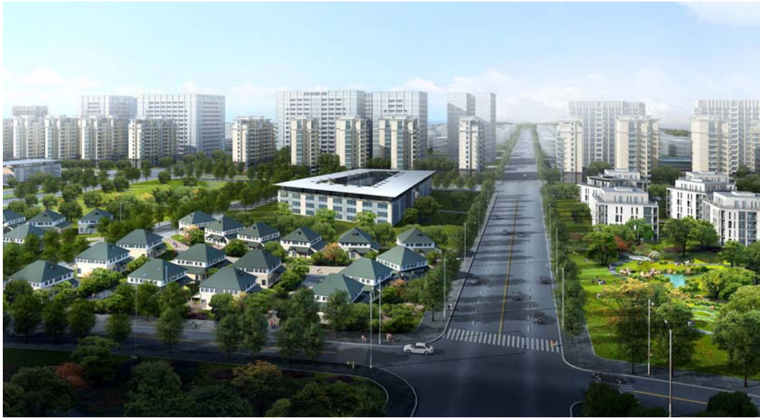
(戸建住宅イメージ)