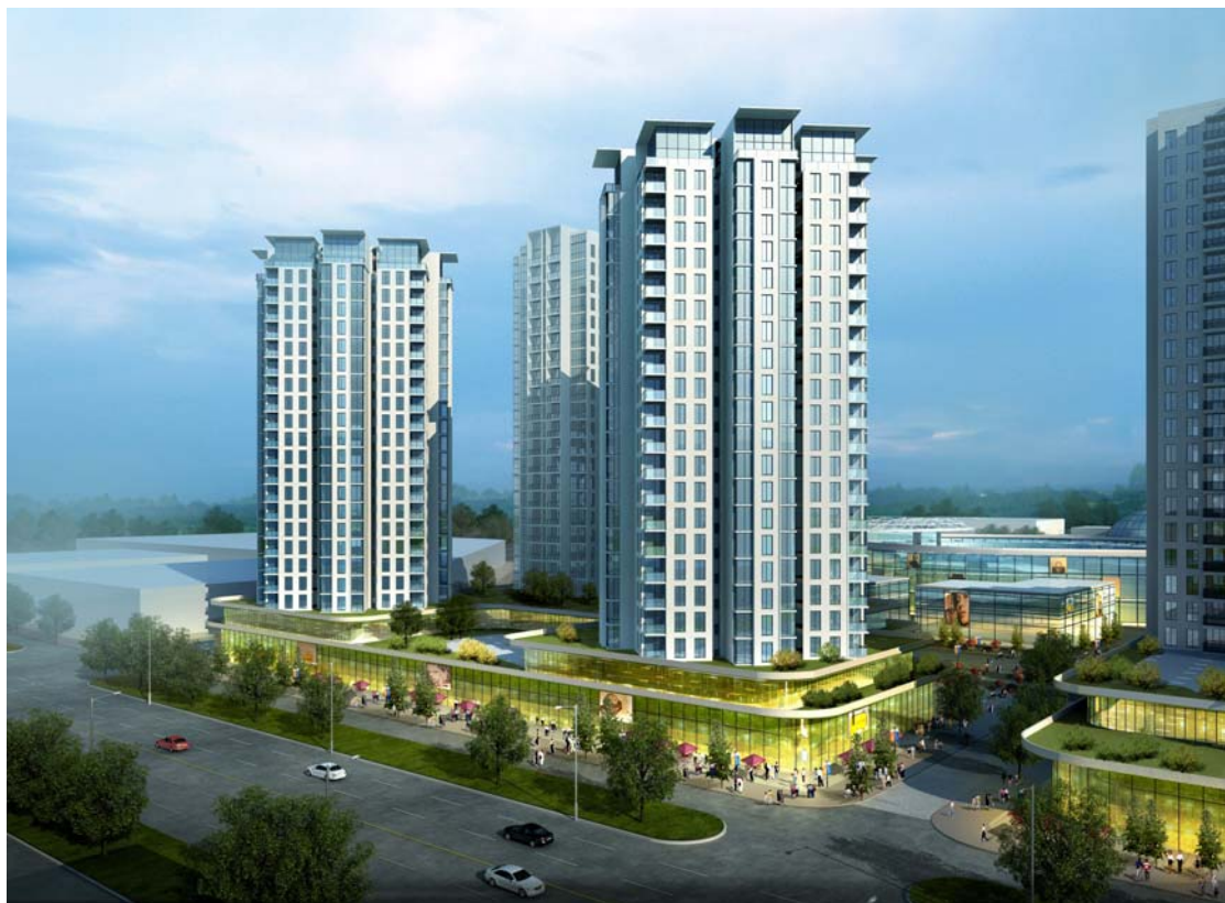
(集合住宅イメージ)